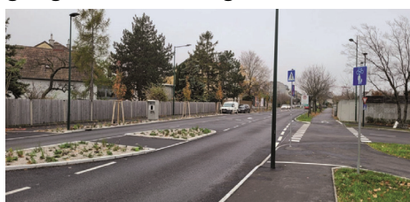
Radweg entlang der Steinfeldstraße

Ab 2020 begann die Marktgemeinde Maria Enzersdorf – gemeinsam mit Mödling und Wiener Neudorf – die Planung der Straßenquerung zu Fuß und/oder per Rad über die Grenzgasse und die Planung der Verbindung zum neuen Radweg entlang der Steinfeldstraße nach Wiener Neudorf. Die schon lange anstehenden Wünsche und Anregungen aller beteiligten Gemeinden