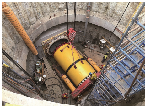
Blick in die Startbaugrube (Symbolfoto)